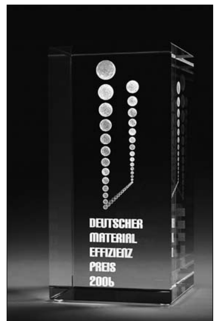
Abbildung 3: Deutscher Materialeffizienzpreis 2006

Um beurteilen zu können, welche Abfallgruppen die besten Ansatzstellen für Maßnahmen der Abfallvermeidung darstellen, muss geprüft werden, mit welchen Abfallgruppen hohe Umweltbelastungen verbunden sind. Eine Datengrundlage bilden die Abfälle, die der Beseitigung zugeführt werden, aber auch die Abfälle, die verwertet werden. Denn auch für die Abfälle, die der Verwertung zugeführt werden, sind während der Herstellung, der Nutzung und der Abfallverwertung Umweltbelastungen entstanden, die durch die Verwertung weder vermieden noch reduziert werden. Erst eine